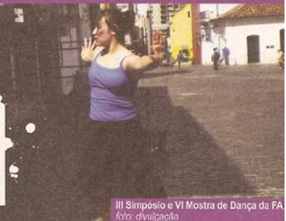
III Simpósio e VI Mostra de Dança da FA

III Simpósio e VI Mostra de Dança da FAP Horário: Manhã e tarde Local: Teatro Laboratório da FAP Ingresso: Gratuito